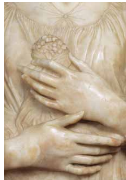
Andrea del Verrocchio Dama dal mazzolino/Lady with Flowers , dettaglio/detail 1475 circa, Firenze, Museo Nazionale del Bargello.