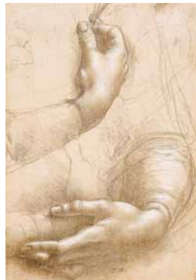
Leonardo da Vinci Braccia e mani femminili; Testa maschile in profilo/Woman's Arms and Hands; a Small Sketch of Man's Head in Profile, 1474-1486 circa