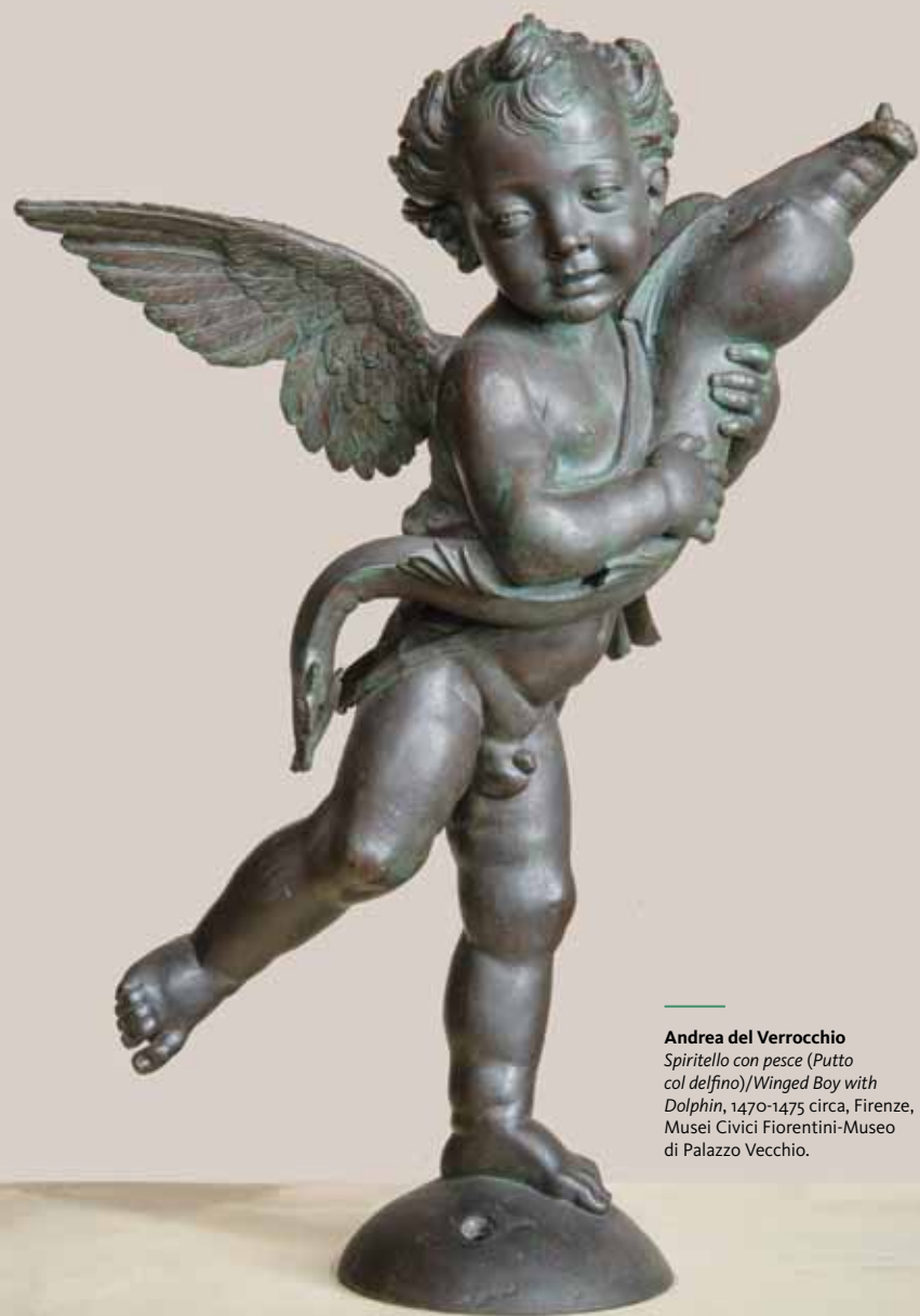
Andrea del Verrocchio Spiritello con pesce (Putto col delfino)/Winged Boy with Dolphin , 1470-1475 circa, Firenze, Musei Civici Fiorentini-Museo di Palazzo Vecchio.