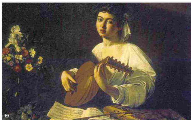
1. «Nel prato (Pace)» di Gaetano Previati, 1889-90. Firenze, Gallerie degli Uffizi, Galleria d'Arte Moderna di Palazzo Pitti. Su concessione del MiBACT 2. «Il suonatore di liuto» di Caravaggio, dall'Ermitage di San Pietroburgo 3. «Ulisse», I sec. d.C., marmo. Sperlonga, Museo Archeologico Nazionale